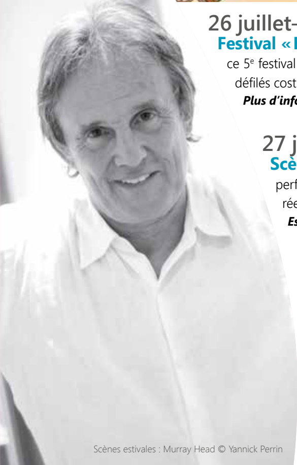
Scènes estivales : Murray Head