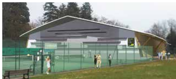
Perspective cabinet d'architecture 2BR.

La Ville va entreprendre la construction de trois courts couverts au tennis club, au lieu-dit Les Mateirons. Le chantier devrait démarrer début octobre. Ces trois courts remplaceront les deux bulles dans lesquelles les joueurs s'entraînaient l'hiver. Le bâtiment sera construit à l'Est en lieu et place de trois courts. La réalisation a été confiée au cabinet d'architecture 2BR. La réfection d'un court contigu au bâtiment est également au programme. La consultation des entreprises est en cours et le chantier devrait démarrer en septembre. Le coût des travaux est estimé à 2 M €.