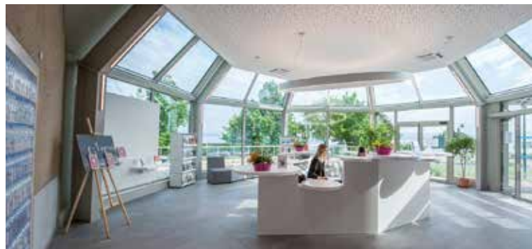
L'office de tourisme dispose d'un nouvel accueil.

L'office de tourisme vient de bénéficier d'un complet lifting. Une transformation à la mesure des ambitions d'« Evian tourisme et congrès » chargé de promouvoir la destination Evian