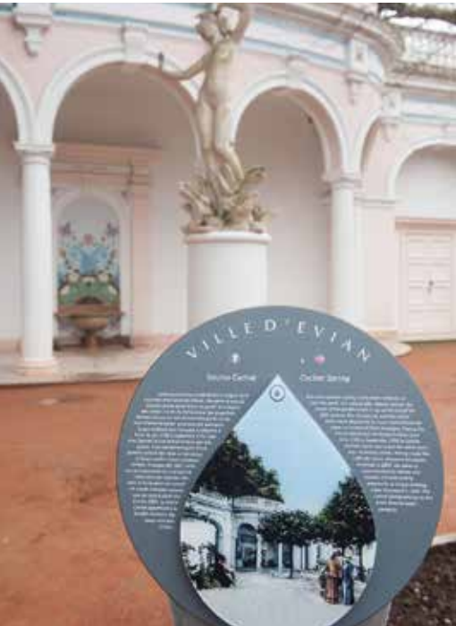
Les treize étapes existantes du circuit ont été complétées par onze nouvelles.

Créé en 1997, le circuit historique vient de faire l'objet d'une refonte complète sous l'égide du pôle tourisme et d'un groupe de travail réunissant élus, techniciens, office de tourisme et acteurs locaux. Les treize étapes existantes ont été complétées par onze nouvelles étapes, afin de prendre en compte tous les éléments du patrimoine : la Maison Gribaldi et la barque « La Savoie » en centre-ville, les Thermes, l'hôtel du Parc à l'Est, l'Octroi et le monument aux rapatriés, la gare et la grande halle, le parc et la villa Dollfus, la Villa La Sapinière à l'Ouest et enfin, l'hôtel Royal, la Grange au lac via le funiculaire au Sud.