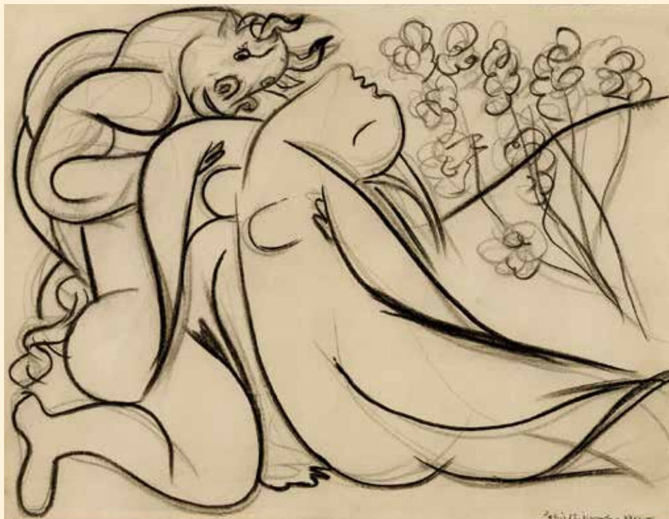
Pablo Picasso, Minotaure et nu , 12 décembre 1933, fusain sur papier. Collection particulière © Succession Picasso 2018