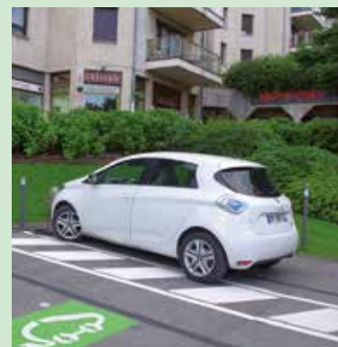
Les bornes de recharge sont installées place de la Porte d'Allinges et avenue de la Gare.

La Ville s'est dotée récemment de deux « eborn », entendez des bornes de recharge pour véhicules électriques et hybrides. Ces installations ont été réalisées en lien avec le SYANE (syndicat des énergies et de l'aménagement numérique de la Haute-Savoie) chargé de déployer le réseau dans le département. Les besoins de la commune ont pour l'heure été estimés à deux bornes. Une première borne a été installée place de la Porte d'Allinges, à proximité de l'office de tourisme et une seconde à proximité de la gare. Elles permettent la recharge simultanée de quatre véhicules. Elles sont accessibles sept jours sur sept et 24 heures sur 24 quel que soit votre véhicule. L'accès est simple, avec ou sans abonnement et le réseau est interopérable et ouvert aux abonnés d'autres opérateurs. Les bornes sont connectées à un central qui garantit un fonctionnement continu et fiable. Grâce à sa collaboration avec le SYANE, la Ville bénéficie du financement de l'ADEME. De fait, 30 % seulement de l'investissement est à la charge de la Ville et le coût de fonctionnement est partagé.