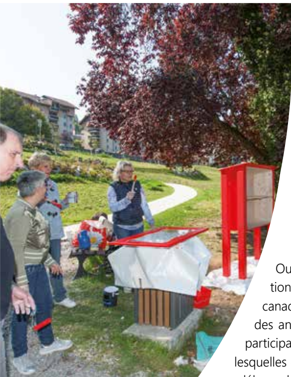
Les comités de quartiers entendent mobiliser les habitants autour d'un projet commun permettant d'améliorer la vie des quartiers à l'exemple des boîtes à livres.

Vous pouvez suivre l'actualité des comités de quartiers sur : www.ville-evian.fr