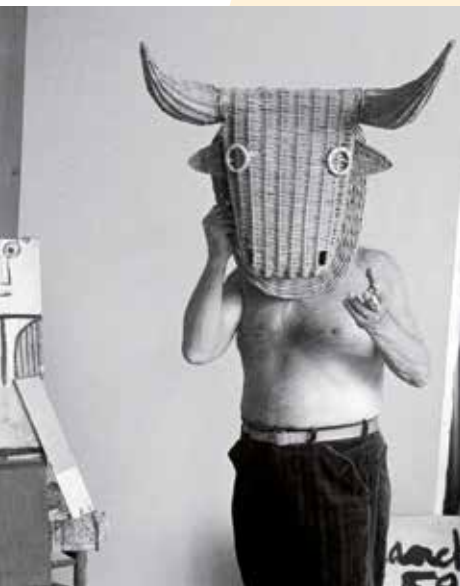
Edward Quinn, Picasso coiffé d'un masque de taureau en rotin , 1959, photographie Musée national Picasso, Paris © Succession Picasso 2018 © Edwardquinn.com

• Visites guidées proposées aux enfants (- 12 ans) accompagnés de leurs parents tous les mercredis à 16h / Visites commentées pour les individuels tous les jours à 14h30: 4€ en plus du ticket d'entrée / - 30% sur les prix d'entrée des expositions en cours à la fondation Pierre Gianadda à Martigny.