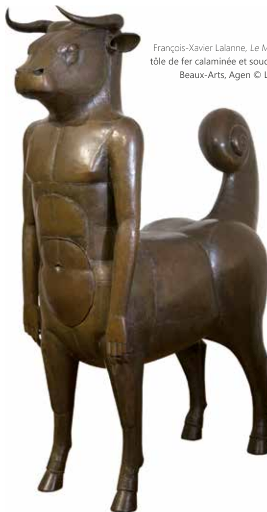
François-Xavier Lalanne, Le Minotaure , 1970, tôle de fer calaminée et soudée, Musée des Beaux-Arts, Agen © Lalanne ADAGP

Dans le cadre de la promotion du Palais Lumière, la Ville vient de conclure un partenariat avec la fondation Ripaille. Les titulaires d'une carte de membre de la fondation ou d'un billet de visite du château bénéficient d'une réduction de 20% sur la visite des expositions et réciproquement. Ce partenariat s'ajoute à une liste déjà longue dont la fondation Gianadda, la société des Amis du Louvre, l'office de tourisme de Thonon, la Région dans le cadre du Pass Région ou encore, la CGN.