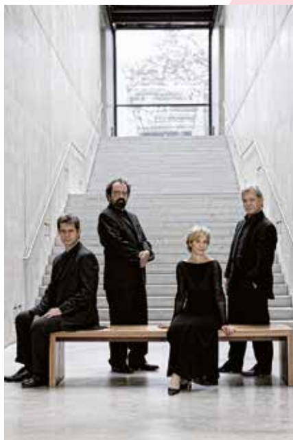
Quatuor Hagen