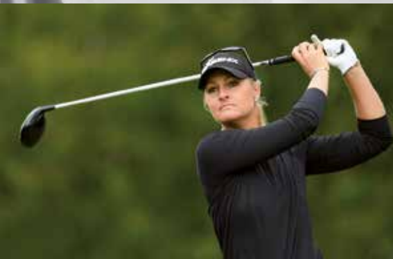
Anna Nordqvist

Évian Championship , quatre jours de sport de très haut niveau avec les 120 meilleures joueuses du monde. Dernière étape de la saison, le tournoi occupe une position stratégique au sein du cercle très fermé des Majeurs du golf mondial. Golf Évian resort. www.evianchampionship.com