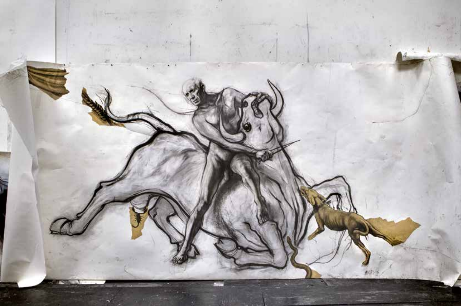
Ernest Pignon-Ernest, Picasso-Mithra , 1992, dessin au fusain. Collection particulière