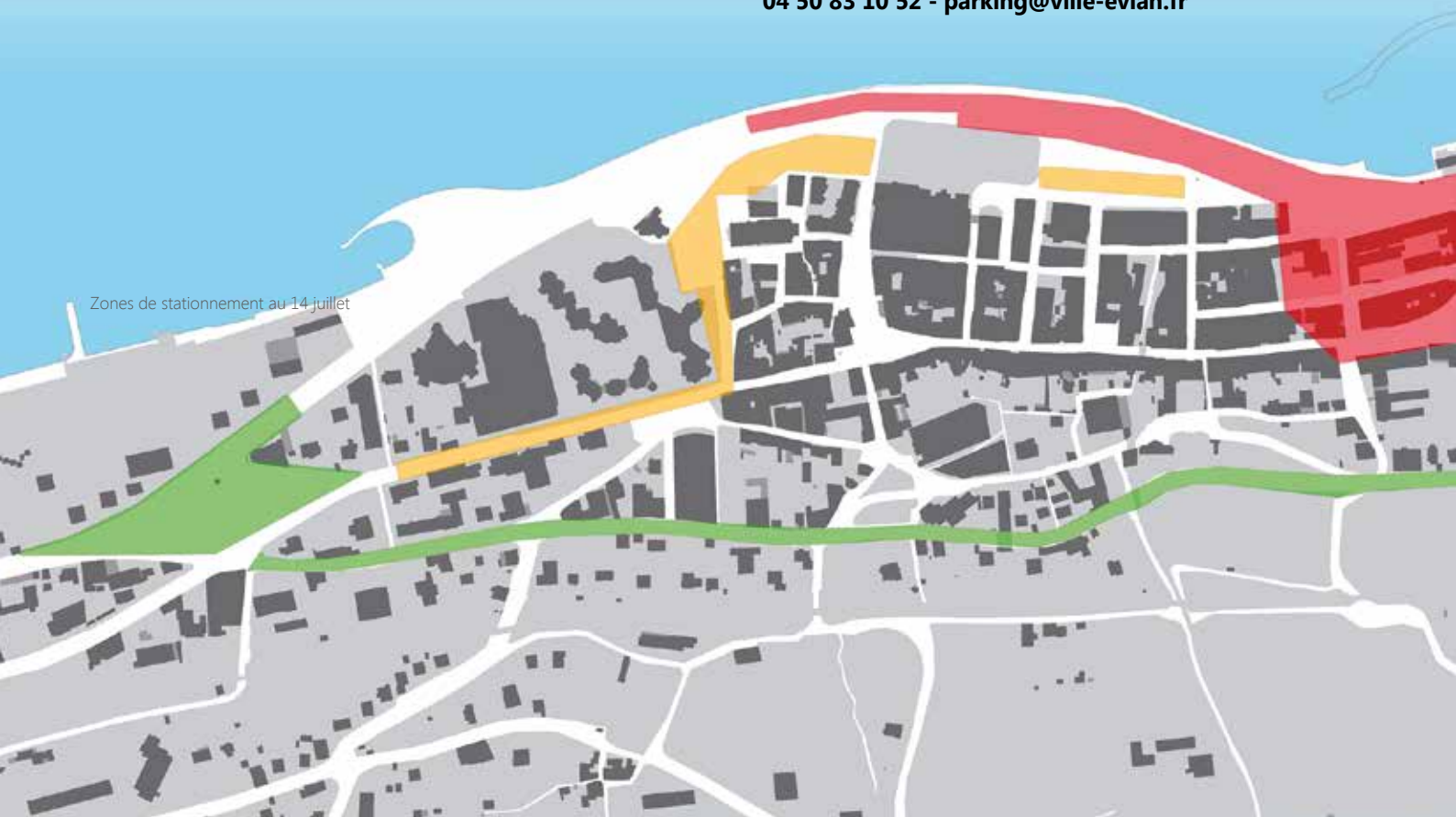
Zones de stationnement au 14 juillet