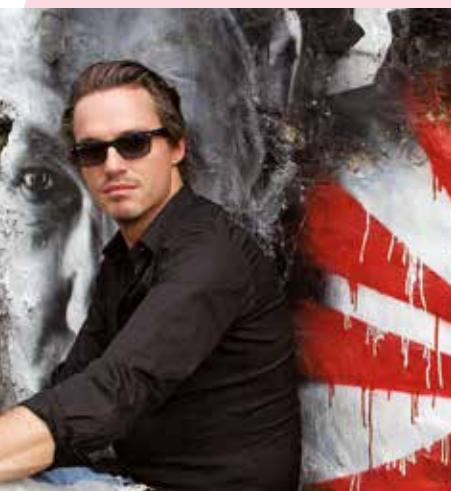
Jeudis electros : Anton X

Rue des artistes des cinq sens , peintres, sculpteurs, artistes et artisans investissent le centre-ville. Rue Nationale, 10h-19h.